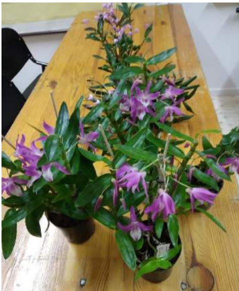
Collectie van Udo. Stekjes van zijn "moederplant" Dendrobium Rainbow dance