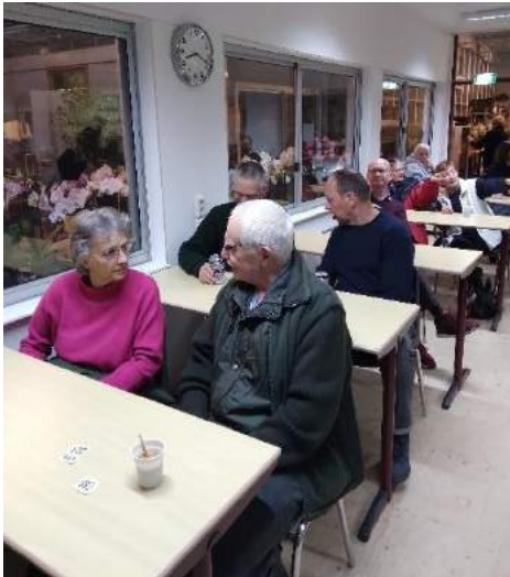
Gezellige "klassenfoto's" van de bijeenkomst 9 april