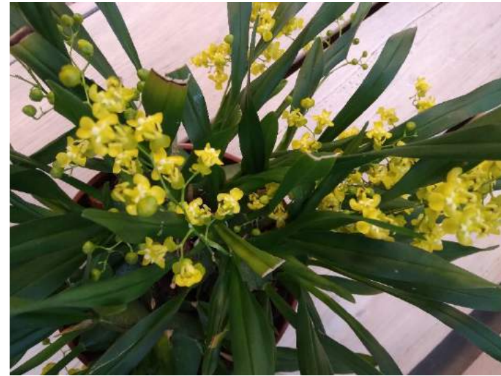
Oncidium cherophorum van Nel. Bloeit al weken en staat op het oosten.